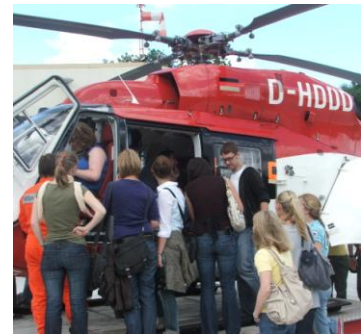
Teilnehmer der Sommerschule 2009 am Rettungshubschrauber

Im vergangenen Jahr haben wir uns mit der Sommerschule Human Factors für Studierende auf neues Terrain gewagt – es hat sich gelohnt; die Sommerschule 2009 war ein großer Erfolg! Während der zehn Tage in der Jugendherberge am Scharmützel-See bei Berlin haben die Studierenden viele verschiedene Themen aus der Human-Factors-Psychologie erarbeitet.