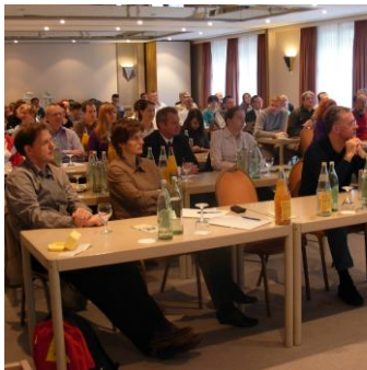
Tagungsteilnehmer während eines Vortrags

Traditionsgemäß startete die Tagung am Mittwochabend mit einem gemütlichen