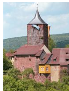
Burg Rothenfels am Main

Der Erfolg der Sommerschule und Anfragen nach einer Wiederholung haben uns ermutigt, für 2011 wieder eine solche Seminarwoche anzubieten. Wir haben für den 6. bis 14. August 2011 Räume auf Burg